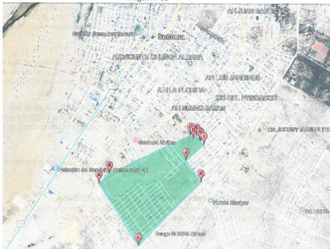
Imagen N° 01

Localidades : AA.HH. Los Portales Distrito : Sechura Provincia : Sechura Departamento : Piura